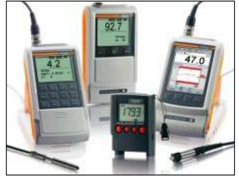
ISOSCOPE, DELTASCOPE 和 DUALSCOPE 内置一体化或外置独立探头的手提式仪器，可在现场快速简便地测量涂镀层厚度

该手册包含的一般描述或性能特征，可能不适用于所有已描述的具体应用，或者由于产品更新会有更改。这些性能特征只有在合同中表述才具有约束力。