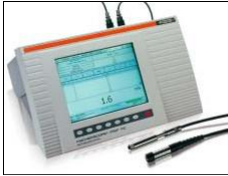
FISCHERSCOPE MMS PC 是一款多功能的测试仪器，可集成磁感应、电涡流和beta射线等方法测量涂镀层厚度和材料测试