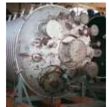
图1：双相不锈钢制造的高防腐性能的锅炉

化学和石油化工行业越来越多地使用双相钢，例如：图1和图2中的锅炉容器就是用高防腐性能的双相不锈钢制造的。如果焊缝处的铁素体含量过低，受到张力或发生振动时容易破裂。然而，在焊接双相钢时，由于焊接添加剂或热处理不当，焊缝处的铁素体含量非常容易超标。只有现场检测才能确保处理过程不会改变最佳的铁素体含量，防止机械性能或腐蚀性能的下降。