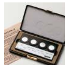
Fischer校准标准片套件（含证书）

为了获得可以比较的结果，仪器必须用可以追溯到国际上接受的二级标准片校准。为此，IIW（英国国际焊接协会）发展了二级标准片，由英国焊接协会根据DIN EN ISO 8249标准和ANSI/AWS A4.2标准规定的方法制造。Helmut Fischer提供鉴定过的校准标准片供客户校准仪器，这些标准片可以追溯到TWI二级标准片。标准片上标明了两种单位：铁素体个数FN和百分比含量%Fe。可通过发货前设置修正系数或用客户定制的标准片校准仪器来减少工件几何形状（曲率、厚度等）对测量的影响。不同的校准信息分别储存在不同的应用程序内。