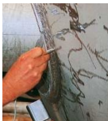
图2：测量焊缝处的铁素体含量