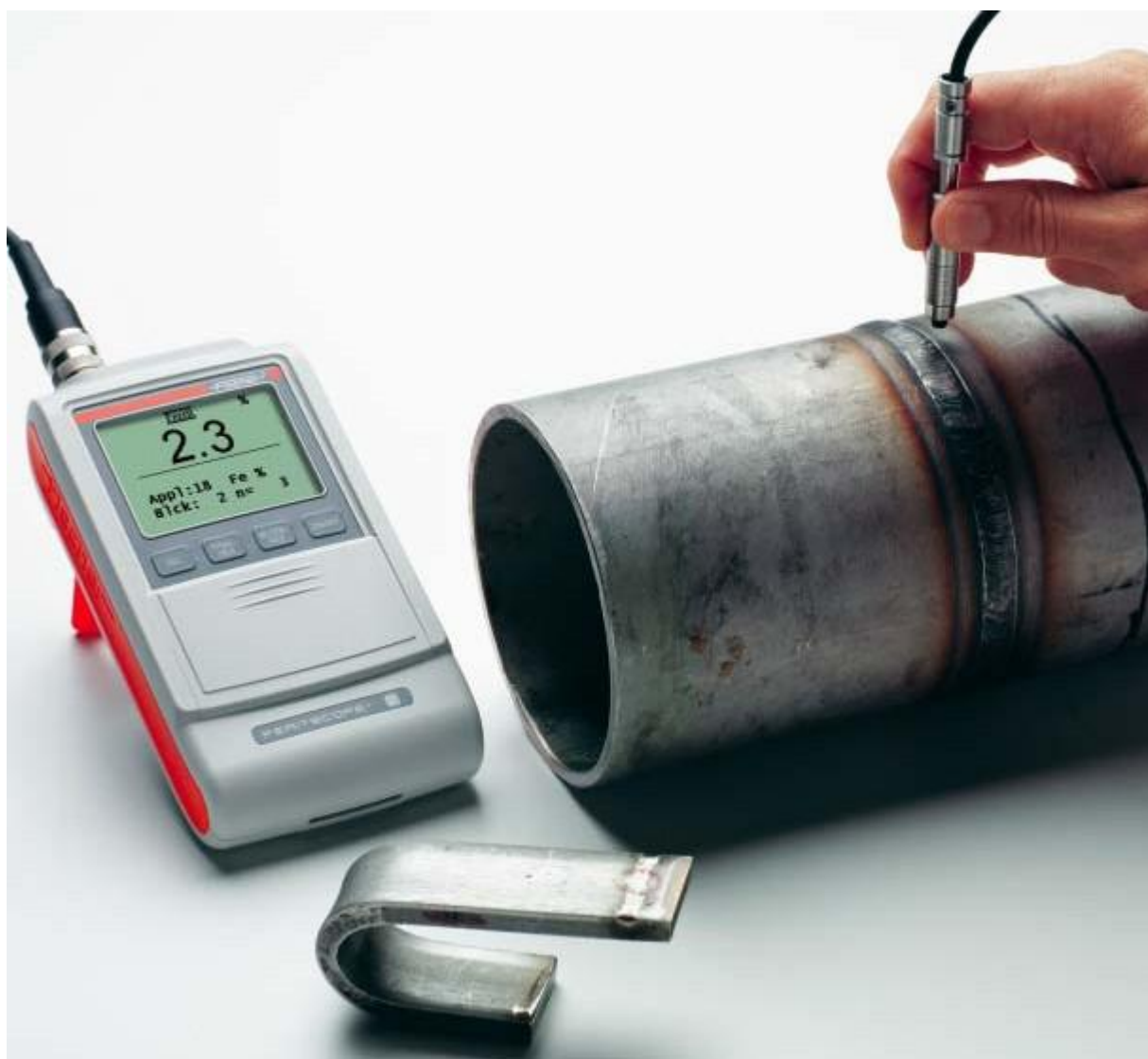
用FERITSCOPE FMP30测量焊缝内的铁素体含量

FERITSCOPE根据磁感应方法测量奥氏体钢和双相钢中的铁素体含量。仪器能识别所有的磁性部件，也就是说，除了delta铁素体，还能识别其转化形式马氏体。仪器符合Basler标准和DIN 32514-1标准，适合于现场检测，可以测量奥氏体覆层、不锈钢管道、容器和锅炉焊缝内以及奥氏体钢或双相钢制造的其他产品内的铁素体含量。