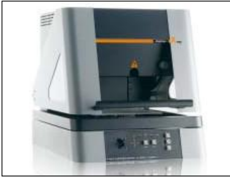
FISCHERSCOPE X-RAY XDAL根据X荧光射线方法测量镀层厚度和材料分析

作为一家技术上领先，高质量标准和搞客户满意度标准的公司，我们已通过DIN ISO 9001:2000认证。